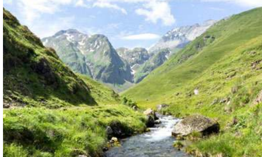
Vallée de la Géla