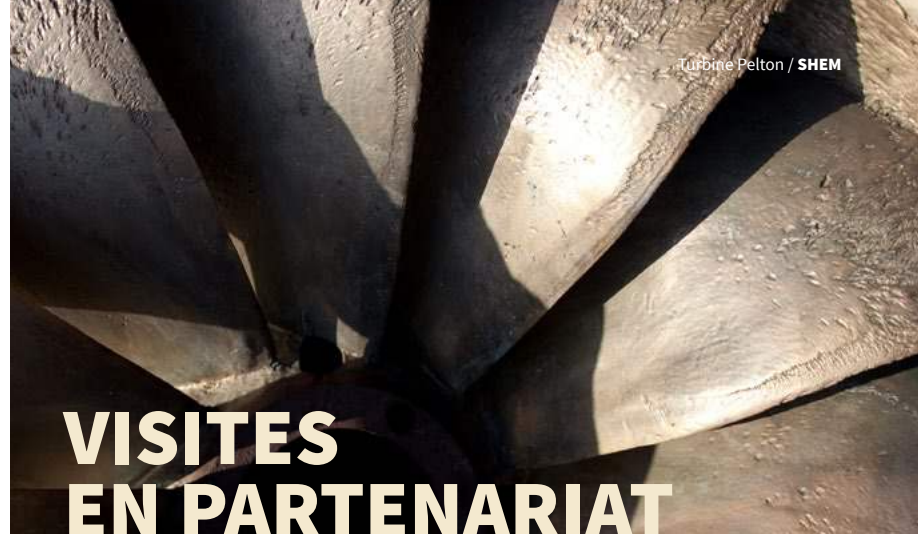
Turbine Pelton / SHEM

Situé sur le fond plat de la vallée à 770 mètres, Bazus fut une importante seigneurie. Le village a été détruit par un incendie en 1630 et à nouveau en 1732, mais conserve néanmoins un patrimoine agro-pastoral important.