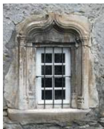
Fenêtre à Ancizan