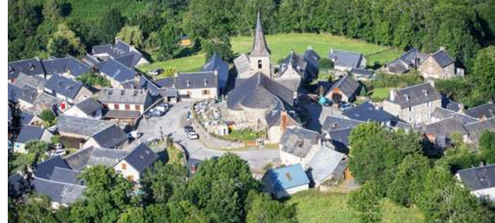
Village d' Azet