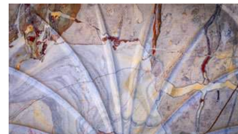
Fontaine en marbre à Ilhet