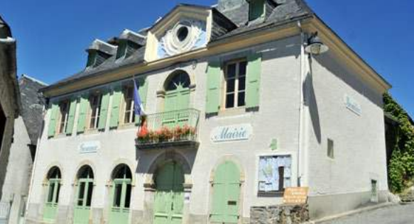
Village de Gouaux