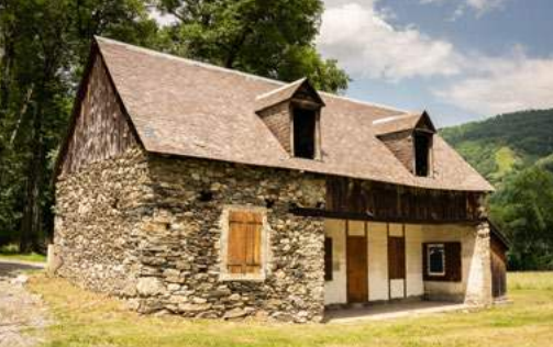
Bains de Saoussas