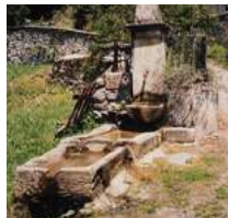
Fontaine à Bazus-Aure