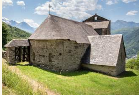
◀ Église de Saint-Calixte ▼ Peintures église d' Aulon