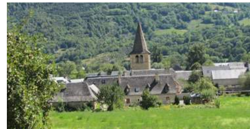
Village de Vielle-Aure