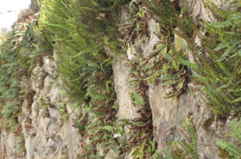
Murets en pierres sèches à Aulon