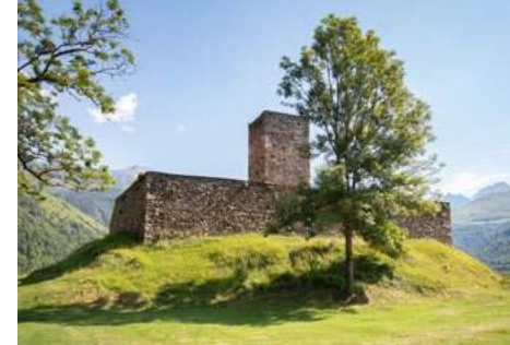
Tour de Génos