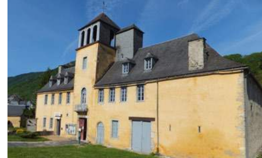
Château des Nestes à Arreau