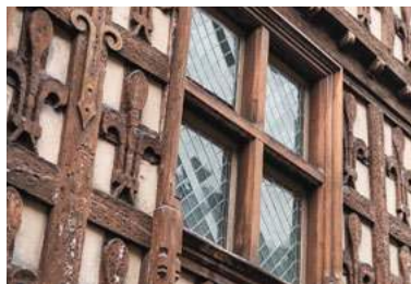
Maison des Lys à Arreau